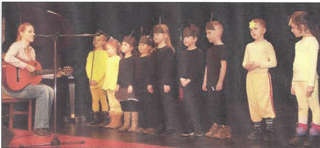
Pěvecký sbor z MŠ Čapkova při vystoupení